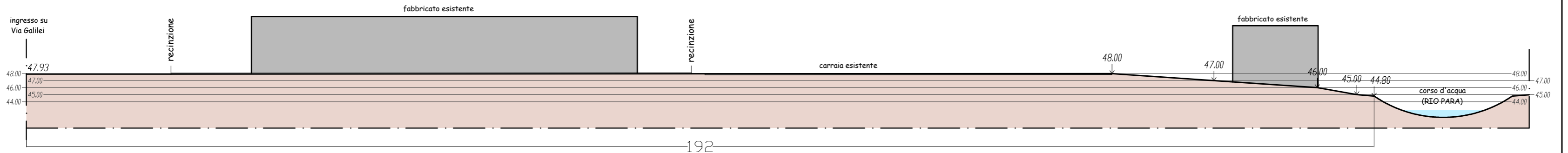
SEZIONE A:A, scala 1:250